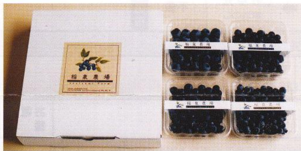
●1ケース/約180g入×4パック