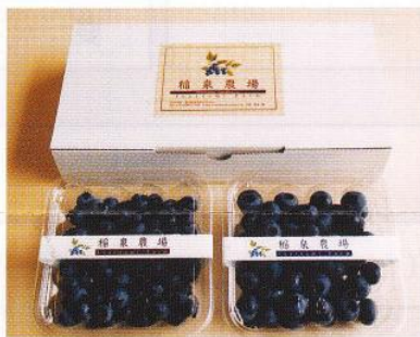
●1ケース/約180g入×2パック